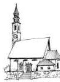
Parrocchia di Imèr