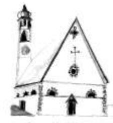
Parrocchia di Mezzano

Piazza della Chiesa, 3 38050 Imèr (TN) Telefax: 0439.67087 Don Nicola: 348.6714592 imer@parrocchietn.it www.decanatodiprimiero.it