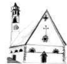
Parrocchia di Mezzano