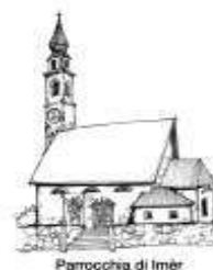
Parrocchia di Imèr